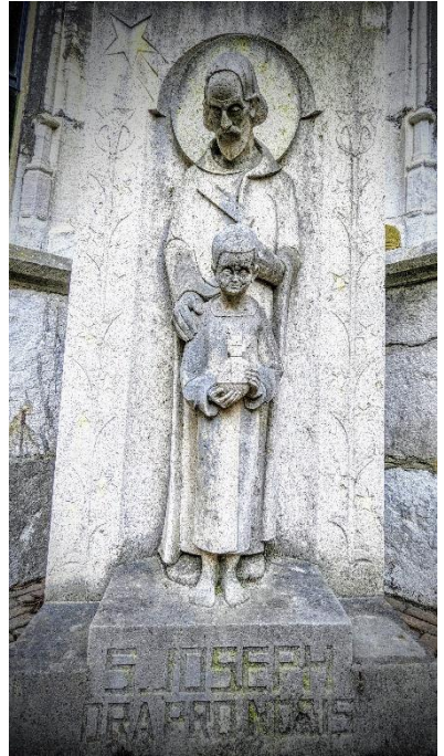
het beeld van Sint Jozef in de pandhof van de Basiliek

150 jaar geleden heeft paus Pius IX de heilige Jozef op 8 december 1870 uitgeroepen tot universele beschermer van de Kerk. Dit bijzonder jubileumjaar nodigt ons uit om naar de heilige Jozef te gaan in onze moeilijkheden. Hij heeft het kindje Jezus beschermd tegen de dreiging van Herodes. Hij kan ook ons beschermen in alle nood, in het bijzonder in het coronagevaar. Laten we onze voorbeden toevertrouwen aan zijn vaderlijke hart.