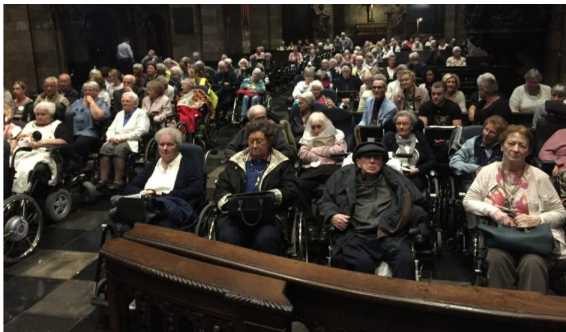
Druk bezochte ziekenzegening in Onze Lieve Vrouw op 10 oktober 2018

en zangeressen zijn altijd van harte welkom om ons gezellige en mooie koor te versterken. Kom geheel vrijblijvend kijken en luisteren tijdens een repetitie: donderdag, 19.45-21.45 u in het Pieterkelderke.