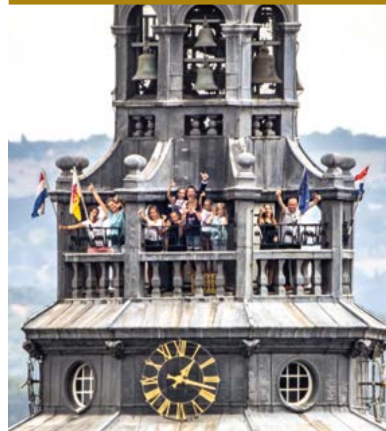
Vormgeving: Van Lint in vorm